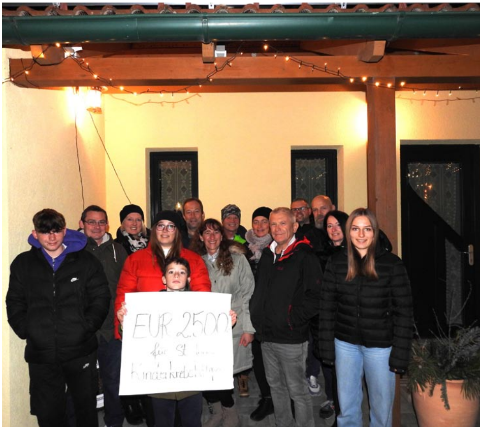
Bericht u. Foto: Claudia Wollner

10-jähriges Jubiläum! Nach 3-jähriger Pause fand am 8. Dezember 2023 in Alberndorf im Pulkautal/ Trumauerstrasse der Adventmarkt zu Gunsten der Kinderkrebshilfe statt. Die tolle Spendensumme von EUR 2.500,- konnte durch den Einsatz vieler Helfer erreicht werden.